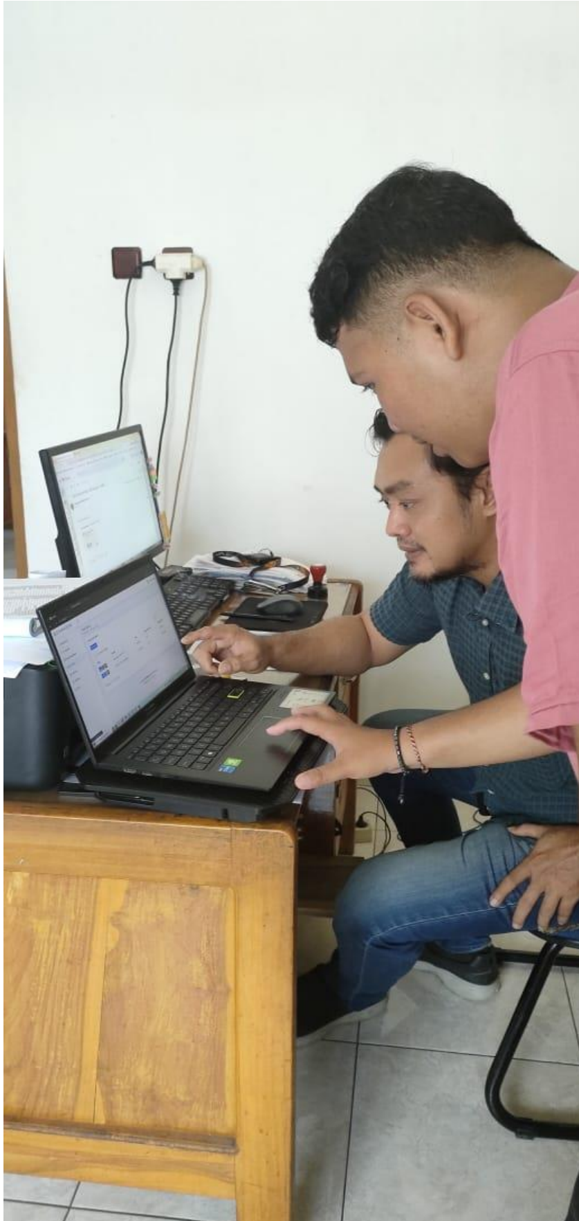
Lampiran 4 Demo Sistem dengan Staf PT Duta Samudera Karya