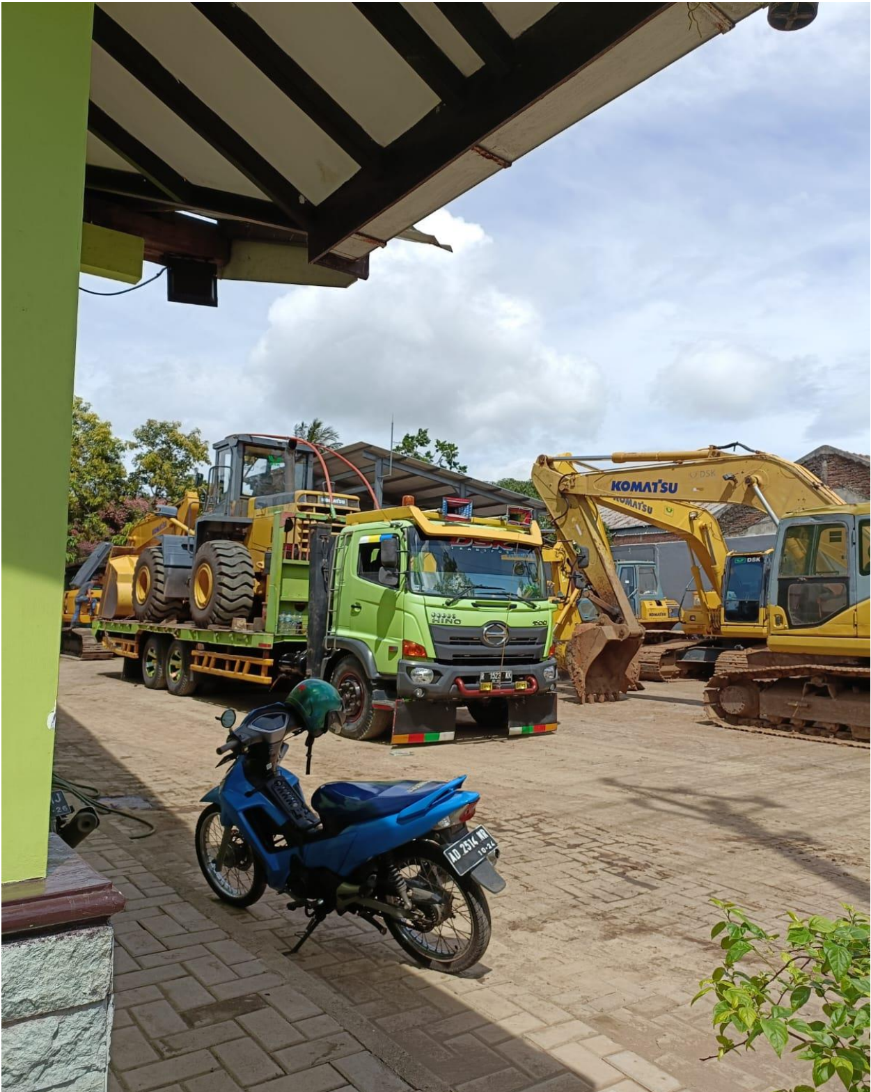
Lampiran 5 Kantor PT Duta Samudera Karya