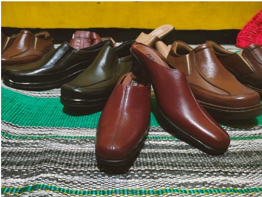
Produk yang dihasilkan oleh UMKM PROHANA